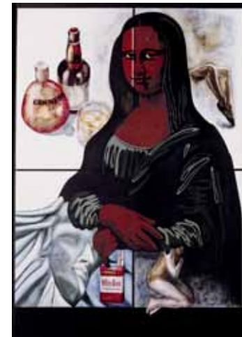
La gioconda, 1973