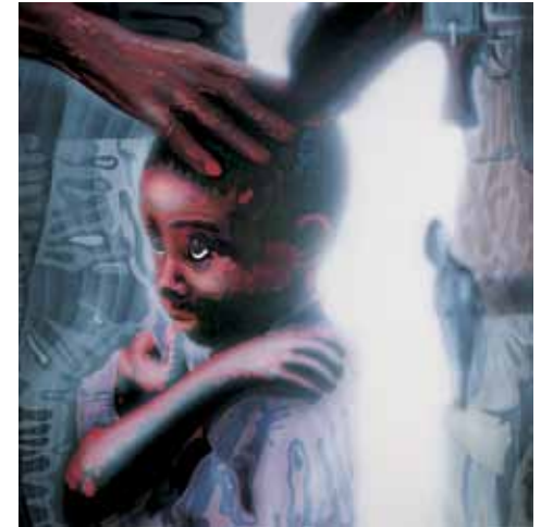
Sobre la guerra, 1972