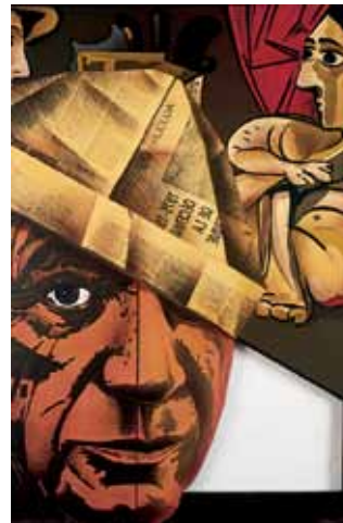
El pintor i la model, 1987