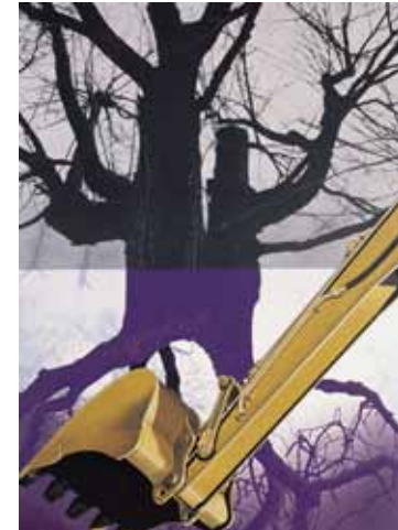
Tres branques, 1993