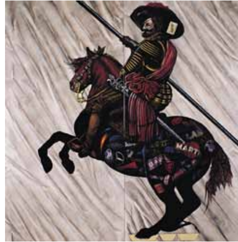
Retrat eqüestre, 1982-84