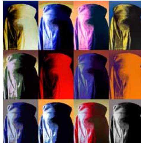
Burka pol-iptíc, 2007

Una nova col·lecció on pretén ressaltar el missatge de protesta a partir de la mateixa denominació del quadre com una ajuda i guia o complement. En tota la trajectòria d'Antoni Miró els títols han estat un punt important per a esbrinar, a voltes de forma contradictòria o irònica, el sentit de les seues obres. Així, sovint ha usat també versos de poetes com Ausiàs March, Salvador Espriu, Miquel Martí i Pol, Vicent-Andrés Estellés o Miguel Hernández. La sèrie representarà per a l'artista la incorporació de noves tècniques en el tractament de les imatges prèvies de la quotidianitat que li interessien. Una vegada més porta a terme una denúncia de les injustícies i desequilibris socials, així com una personal relectura entorn de la ciutat i els museus.