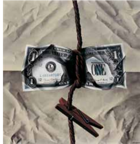
Dólar enforcat, 1974

Miró denunciava el poder del capitalisme, a través del símbol de la moneda nord-americana, que pressionava governs i instituïa dictadures com la xilena. Així mateix, es posava de manifest, de manera crítica, la falsa idolatria del que representava el bitllet verd, com a nou objecte-tòtem de dominació a escala mundial.