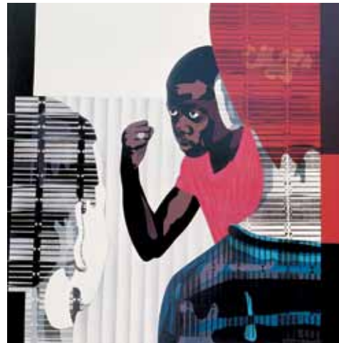
Lluita d'infants, 1972