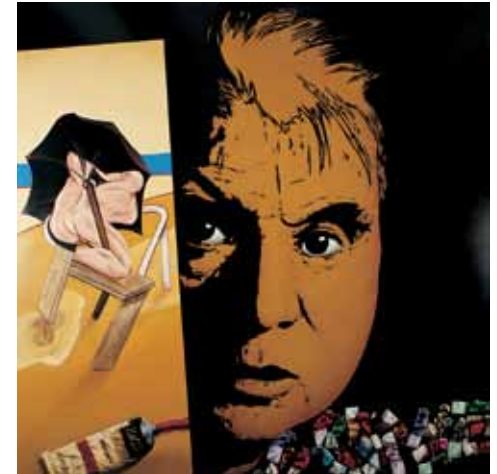
Món de Bacon, 1988-89