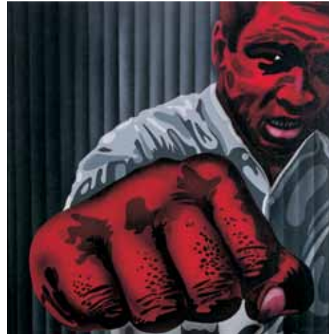
A cops, 1972

La sèrie "Amèrica Negra" s'exposa també en el segon pis de la sala Naies. Acrílic i més acrílic, i en format quadrat, en una més que evident denúncia de la passivitat de les potències econòmiques cap als més desfavorits, en aquest cas, als afroamericans. Un any va dedicar a aquesta sèrie l'autor. Treballs com L'Espera , Misèria i xiquets , Futur negre o Les mans de l'home transmeten a l'espectador el dolor i el patiment d'aquest col·lectiu durant els anys setanta. Miró no canvia: s'engoleix en el temps.