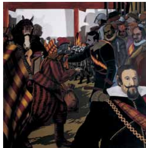
Un poble sota les llançes, 1977