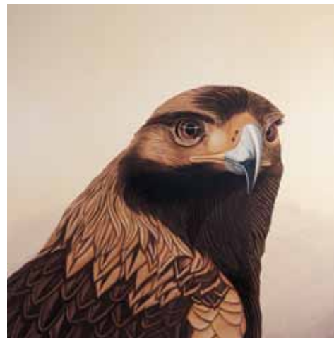
Àliga dissecada, 1977