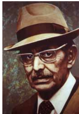
A Enric Valor, 2007