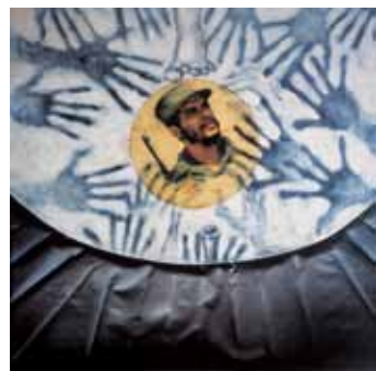
A Che Guevara, 1970