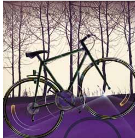
Agressió amesurada, 1992

Aquesta sèrie marca una altra dècada en el treball del pintor alcoià. És tal vegada la més ecològica, entorn del moment d'inquietud general sobre la naturalesa i la seua esquilmació. Antoni Miró va incorporar en aquesta sèrie la preocupació pel futur de la humanitat. Així, un dels temes de referència va ser la degradació del mitjà i els excessos de l'urbanisme descontrolat. La bicicleta va aparèixer com un exemple d'enginy humà que no contamina el mitjà, com una aposta personal de l'artista enmig del crit d'alerta davant el desastre ecològic "Vivace" evidencia l'obsessió de l'autor pel món que ho envolta amb obres com a Litoral mediterrani (1993), Bici aèria (1996) o Horitzó roig (2000).