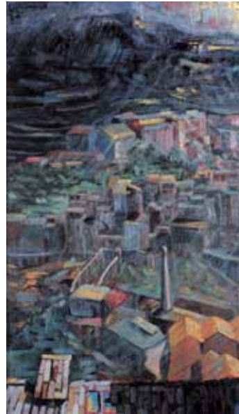
Paisatge d'Alcoi, 1962

Aquestes primeres obres d'Antoni Miró, des del primer quadre pintat en 1960 fins a la fundació dels col·lectius Alcoiart (1965-1972) –el primer grup de tendència del País Valencià– i el Gruppo Denunzia, a Brescia (1972), l'artista s'orientava cap a l'expressionisme figuratiu com una eina per a visualitzar el sofriment de l'ésser humà. A la fi dels seixanta s'encamina cap al neofiguratisme, una completa identificació ideològica amb el moviment anomenat Crònica de la Realitat. Partint del pop-art i del realisme, produeix les sèries Les Nues (1964), La Fam (1966), Els Bojos (1967), Experimentacions , Vietnam (1968) i L'Home (1970).