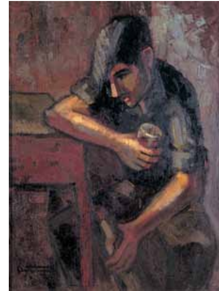
El bevedor, 1960