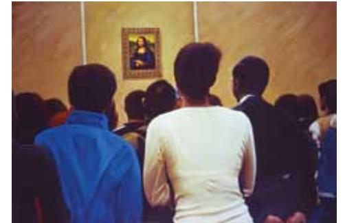
La famosa gioconda, 2008