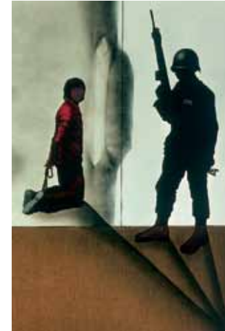
La gran massacre subvencionada, 1974