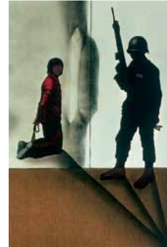
La gran massacre subvencionada, 1974