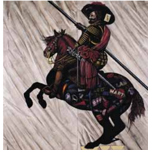
Retrat eqüestre, 1982-84