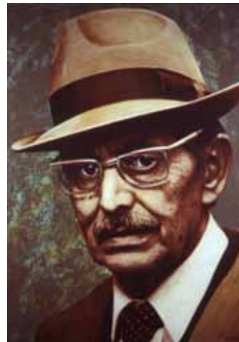
A Enric Valor, 2007