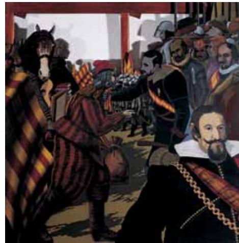
Un poble sota les llançes, 1977