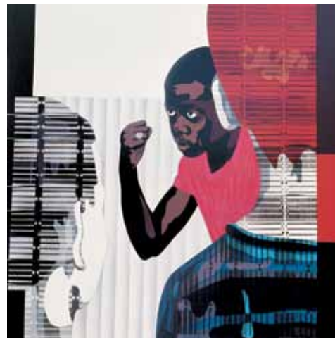
Lluita d'infants, 1972