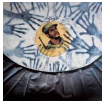
A Che Guevara, 1970