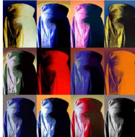
Burka pol-liptic, 2007

Una nueva colección donde pretende resaltar el mensaje de protesta a partir de la misma denominación del cuadro como una ayuda y guía o complemento. En toda la trayectoria de Antoni Miró los títulos han sido un punto importante para averiguar, a veces de forma contradictoria o irónica, el sentido de sus obras. Así, a menudo ha usado también versos de poetas como Ausiàs March, Salvador Espriu, Miquel Martí i Pol, Vicent-Andrés Estellés o Miguel Hernández. La serie representará para el artista la incorporación de nuevas técnicas en el tratamiento de las imágenes previas de la cotidianidad que le interesan. Una vez más lleva a cabo una denuncia de las injusticias y desequilibrios sociales, así como una personal relectura en torno a la ciudad y los museos.