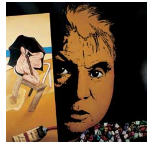
Món de Bacon, 1988-89