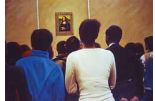
La famosa gioconda, 2008